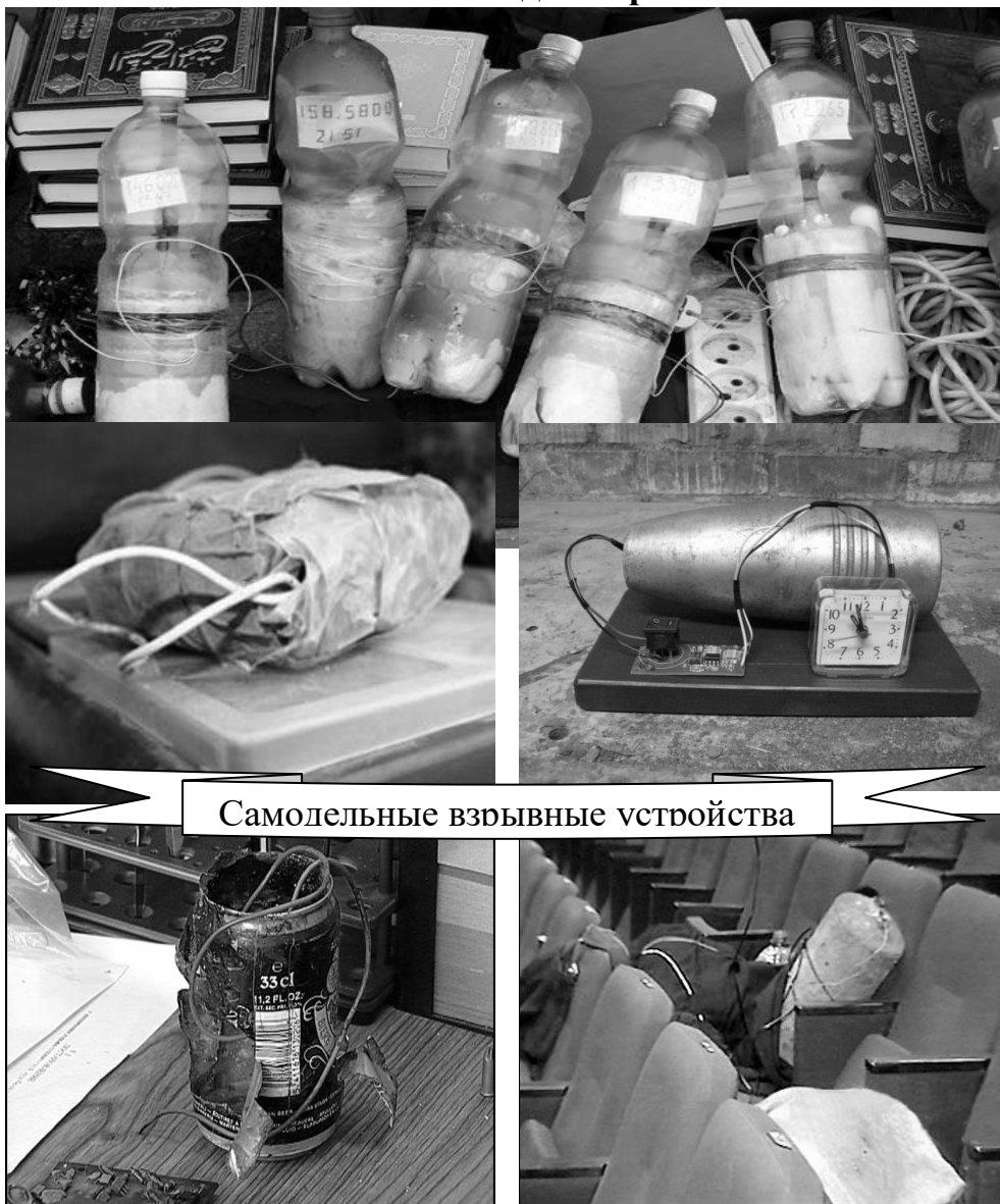
Самодельные взрывные устройства