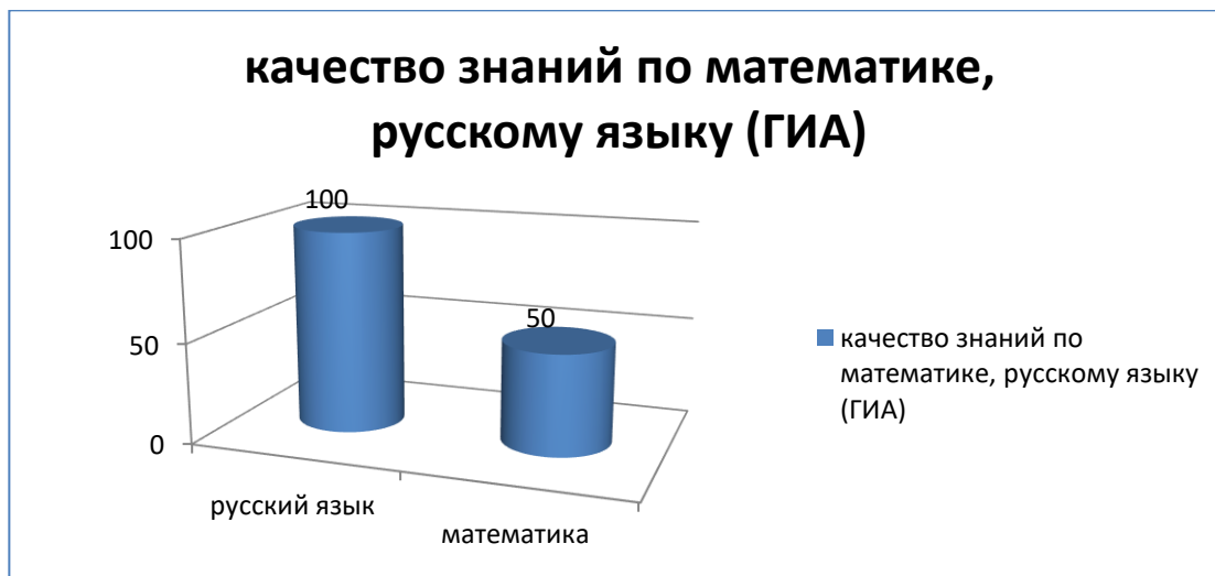
Таблица 10. Результаты итоговой аттестации учащихся 9-го класса (предметы по выбору)